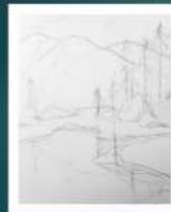
1 этап – набросок карандашом