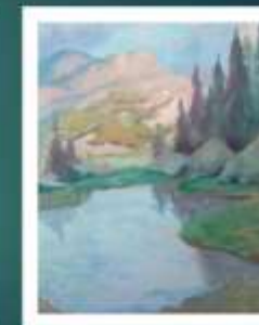
3 этап – детальная прописка