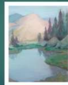
2 этап – подмалевок гуашью